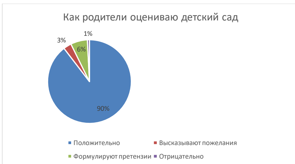
Диаграмма 1. Анкетирование родителей.

Из полученных данных анкетирования родителей (результаты мониторинга удовлетворенности родителями воспитанников детского сада качеством предоставляемых образовательных услуг) можно сделать вывод, что родители работой дошкольного учреждения и педагогов в основном удовлетворены – 94%, не удовлетворены – 6%